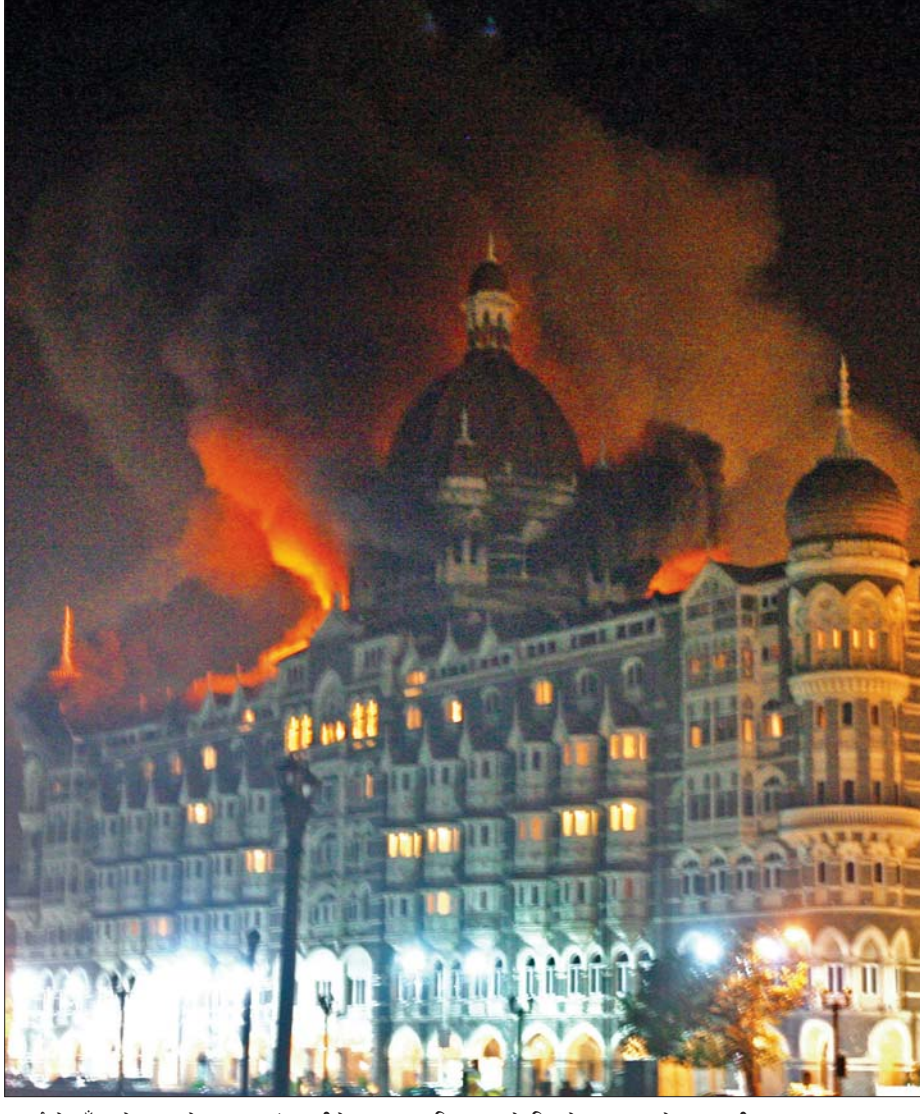
मुम्बईको पाँचतारे ताज होटलमा आतंककारीले बुधवार राति गराएको विस्फोटबाट भएको आगलागी।